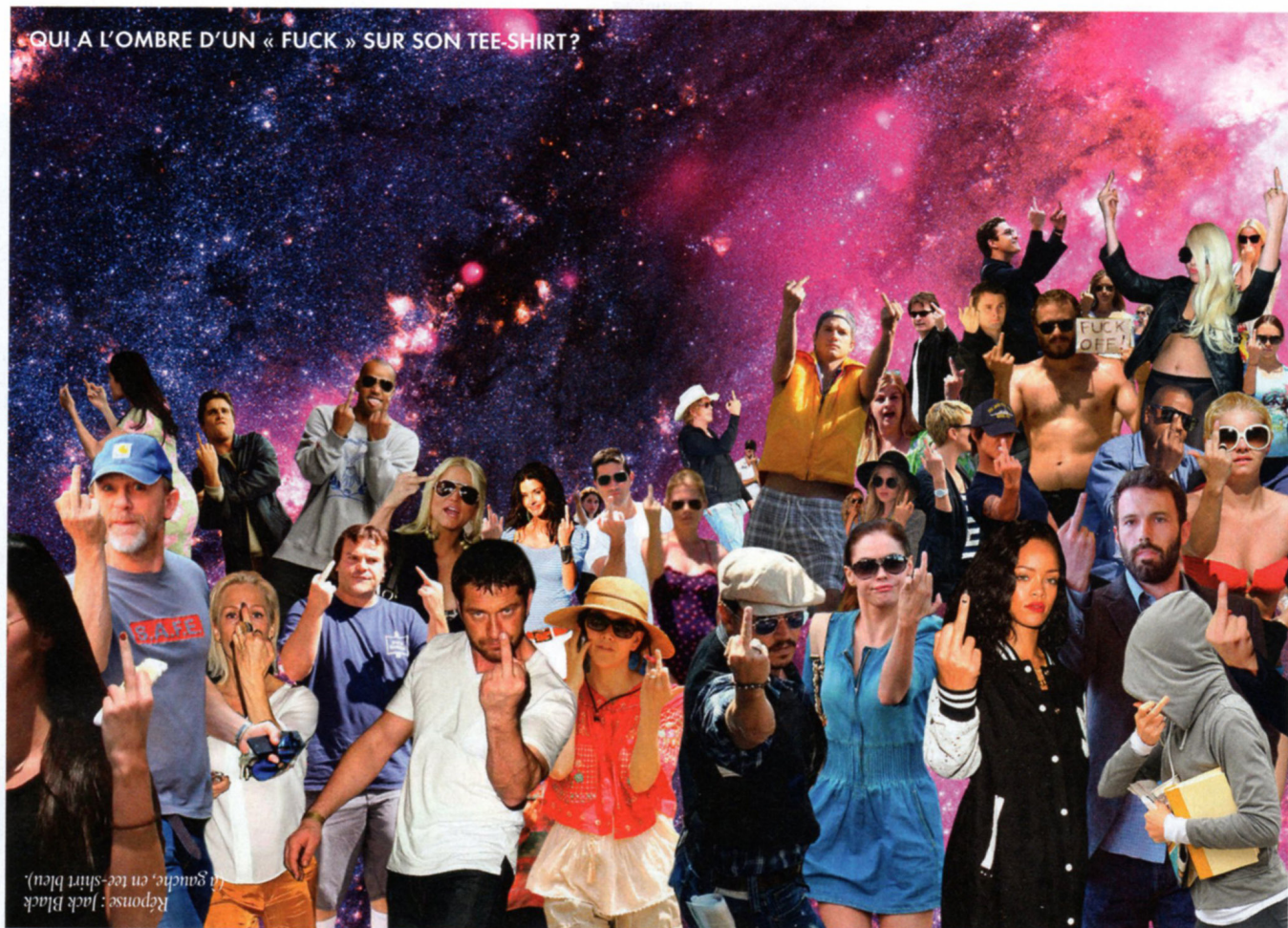
Réponse : Jack Black (qui est tout à gauche, en tee-shirt bleu).

QUI A L'OMBRE D'UN « FUCK » SUR SON TEE-SHIRT ?